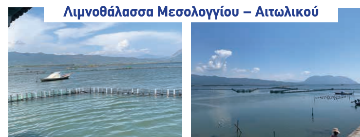
Λιμνοθάλασσα Μεσολογγίου – Αιτωλικού