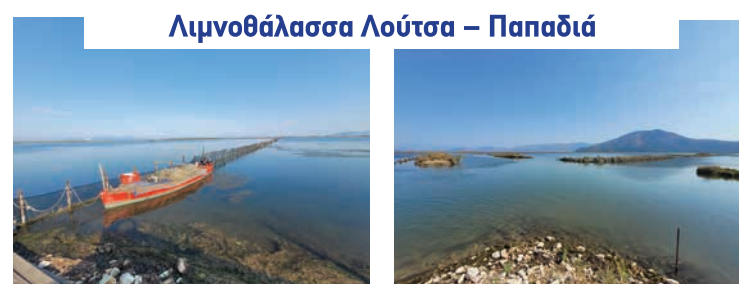
Λιμνοθάλασσα Λούτσα – Παπαδιά