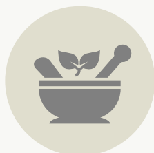
ΦΑΡΜΑΚΕΥΤΙΚΑ ΚΑΙ ΑΡΩΜΑΤΙΚΑ ΦΥΤΑ