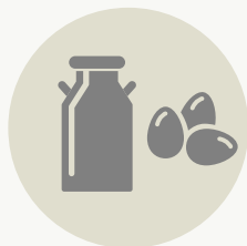
ΓΑΛΑ - ΑΥΓΑ