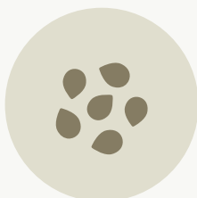
ΣΠΟΡΟΙ & ΠΟΛΛΑΠΛΑΣΙΑΣΤΙΚΟ ΥΛΙΚΟ