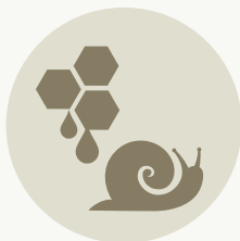
ΜΕΛΙ - ΣΗΡΟΤΡΟΦΙΑ - ΣΑΛΙΓΚΑΡΙΑ